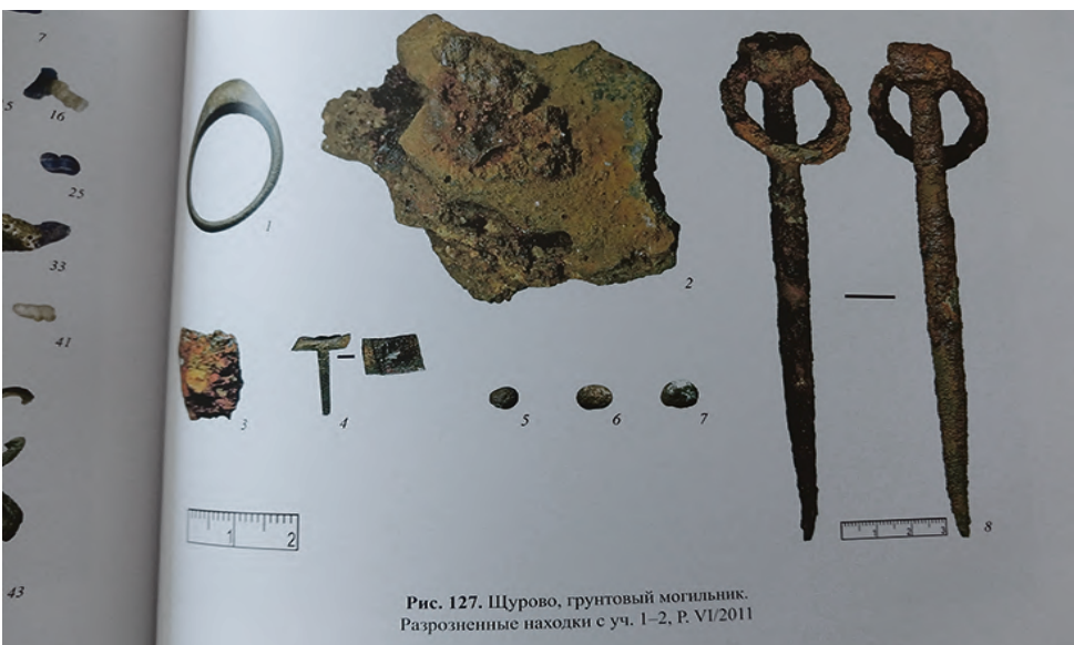
Рис. 127. Щурово, грунтовый могильник. Разрозненные находки с уч. 1–2. Р. VI/2011